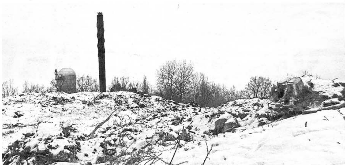
I Skarpnäck ska en ny biogasanläggning byggas. Skogen på industri- tomten höggs ned redan innan detaljplanen ställts ut.

– Hjärtstillestånd är den vanligaste orsaken till att man dör när man blir stungen. Oftast sker det oerhört fort. TT